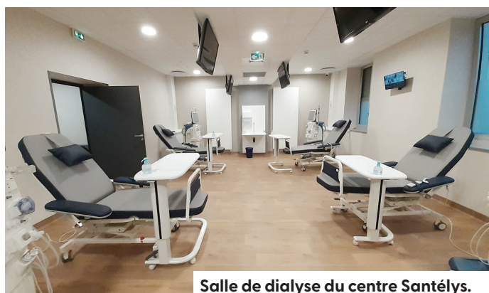
Salle de dialyse du centre Santély.

L'objectif de cette structure est d'accueillir les enfants victimes ou témoins de violence dans un lieu adapté avec des professionnels formés. La prise en charge est pluridisciplinaire médicale, sociale, psychosociale et/ou médico-judiciaire. Une unité de ce type est déployée dans chaque département, dans le cadre du plan national de lutte contre les violences faites aux enfants.