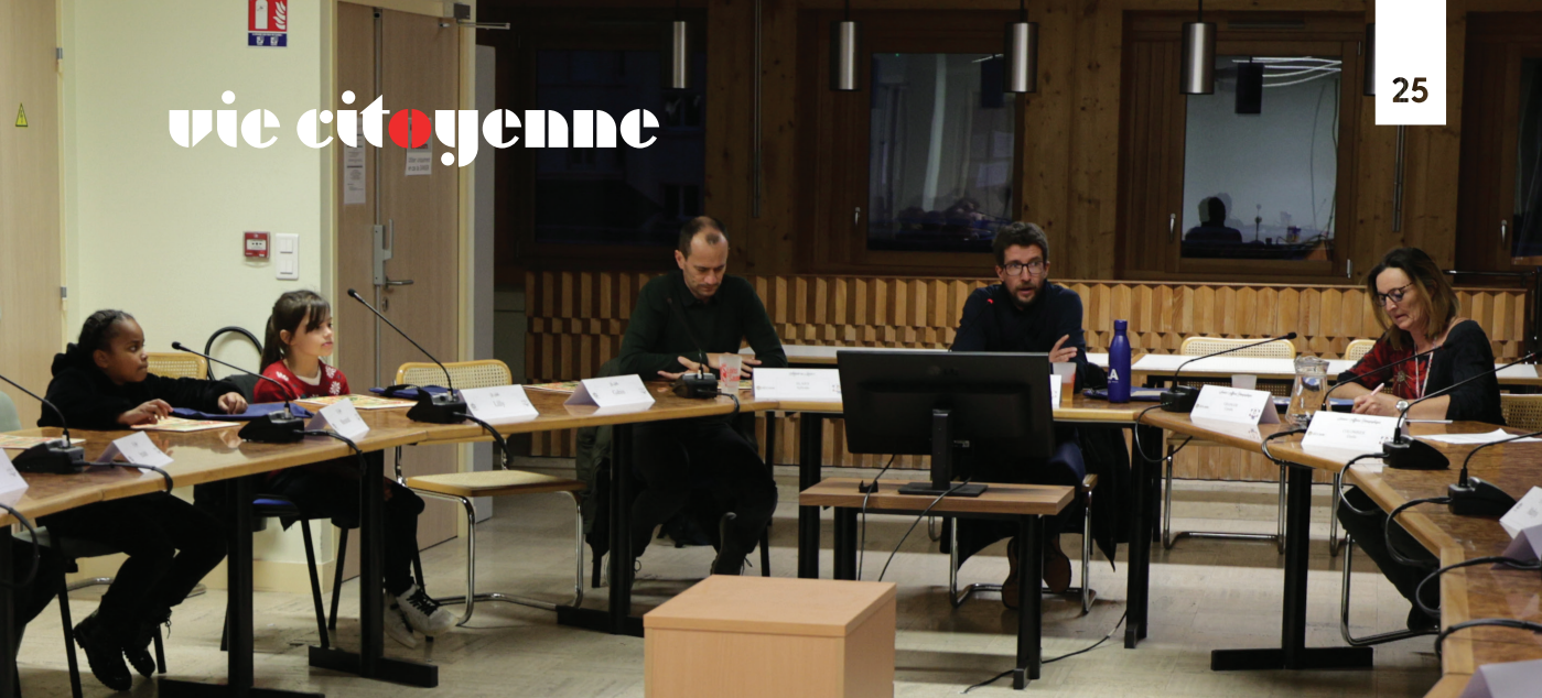
Dernier conseil municipal des enfants de l'année 2023, l'occasion de faire un premier bilan et de préparer 2024.

aux événements organisés par la Ville. » Après un premier projet de boîte à insectes concrétisé rapidement, les enfants travaillent sur « la Brocante des enfants » qui devrait se tenir le 4 mai au Puits Salé, au profit d'associations, et sur une journée de rencontre intergénérationnelle autour du jeu.