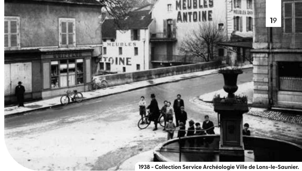
1938 - Collection Service Archéologie Ville de Lons-le-Saunier.

Le rendez-vous est déjà pris en 2024 pour continuer à célébrer cet événement culturel d'importance nationale !