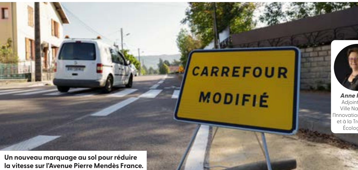
Un nouveau marquage au sol pour réduire la vitesse sur l'Avenue Pierre Mendès France.