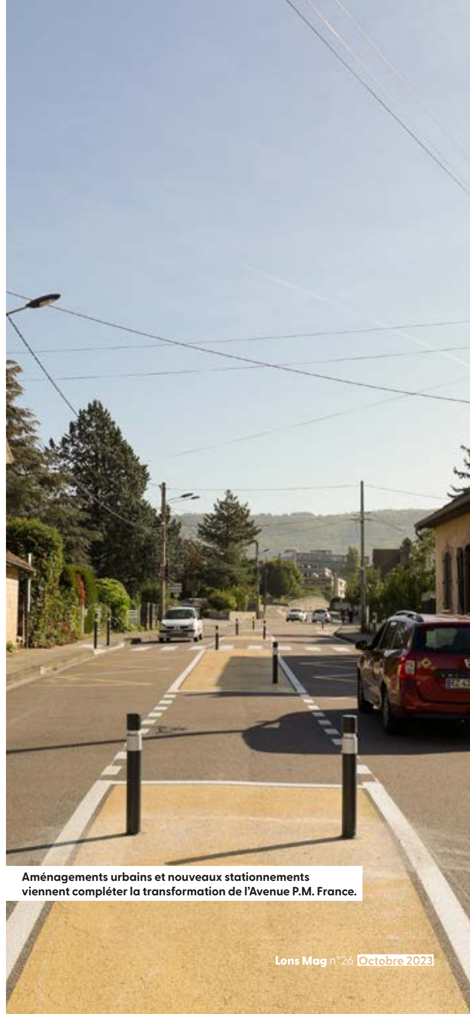
Aménagements urbains et nouveaux stationnements viennent compléter la transformation de l'Avenue P.M. France.

« Lorsqu'ils ne sont pas en sécurité, les vélos et trottinettes roulent sur les trottoirs, ce qui est interdit et dangereux pour les piétons. L'idée est que ces véhicules alternatifs prennent leur place sur la voirie. Nous privilégions le mixte des mobilités, la complémentarité » conclue-t-elle.