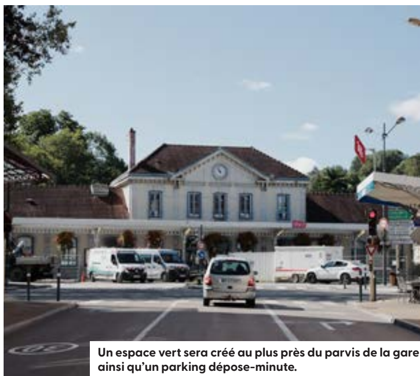
Un espace vert sera créé au plus près du parvis de la gare ainsi qu'un parking dépose-minute.

Les services du Conseil régional et d'ECLA se sont mobilisés sur place pendant plusieurs semaines afin de renseigner les voyageurs, et particulièrement les scolaires, sur le nouveau fonctionnement de la gare routière.