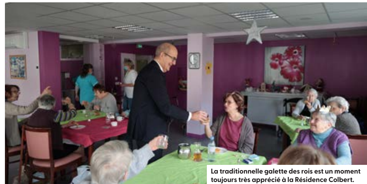
La traditionnelle galette des rois est un moment toujours très apprécié à la Résidence Colbert.

Le C.C.A.S organise également 2 fois par mois le Café des Seniors au sein de la Résidence des Tanneurs, animé par des bénévoles du réseau Tiss'Âges. Ces derniers luttent contre l'isolement des personnes âgées.