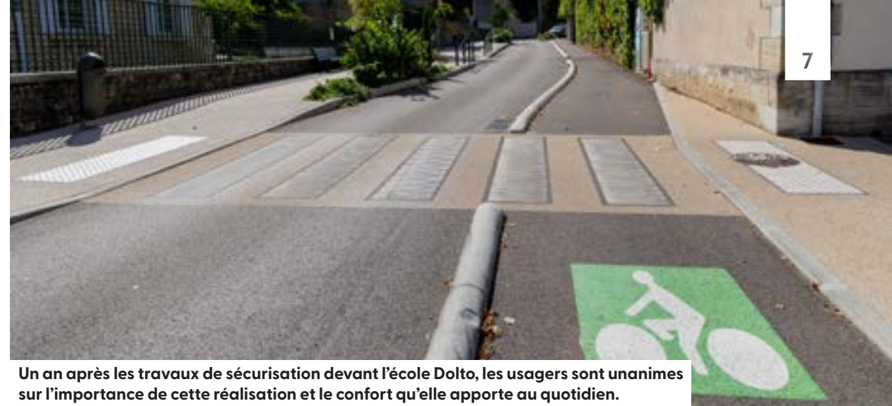
Un an après les travaux de sécurisation devant l'école Dolto, les usagers sont unanimes sur l'importance de cette réalisation et le confort qu'elle apporte au quotidien.

La prochaine cour concernée, dès 2024, sera celle de François Rollet et sera accompagnée d'un projet équivalent sur le parvis de la Maison commune.