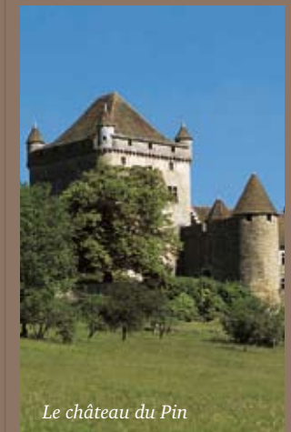
Le château du Pin