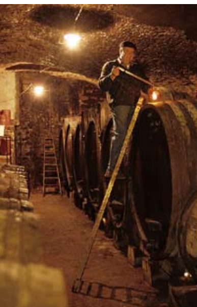
Rencontre avec un vigneron...