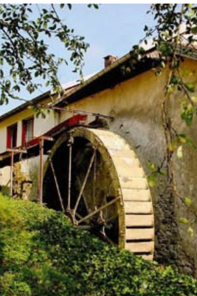
La tournerie, à Ladoye-sur-Seille